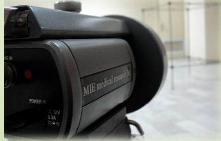
EMG مارک MIE، صفحات نیرو، MMT (MANUAL MUSCLE TEST)، اسکن پا