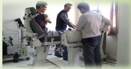
موشن آنالایزر MIE

این بخش با داشتن دستگاه هایی همچون سیستم ایزوکنتیک بایودکس،